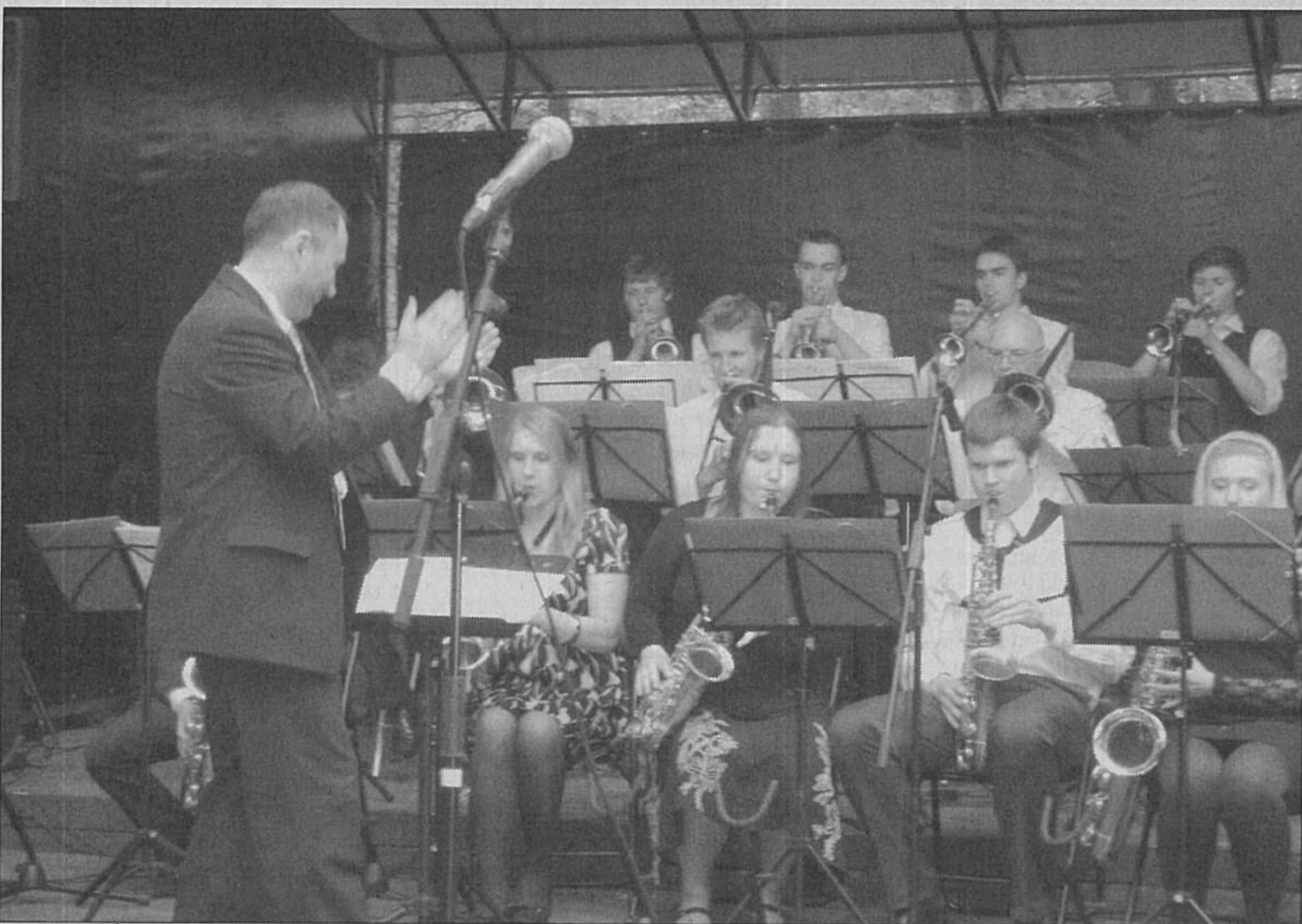
EV meninio ugdymo studijos bigbendas „The Magic Time Orchestra“.