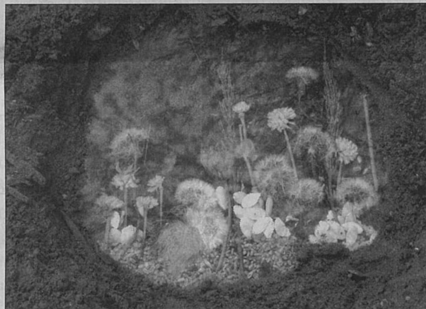
„Ogmios“ centro gėlių salono „Vaikystės sekretai“.