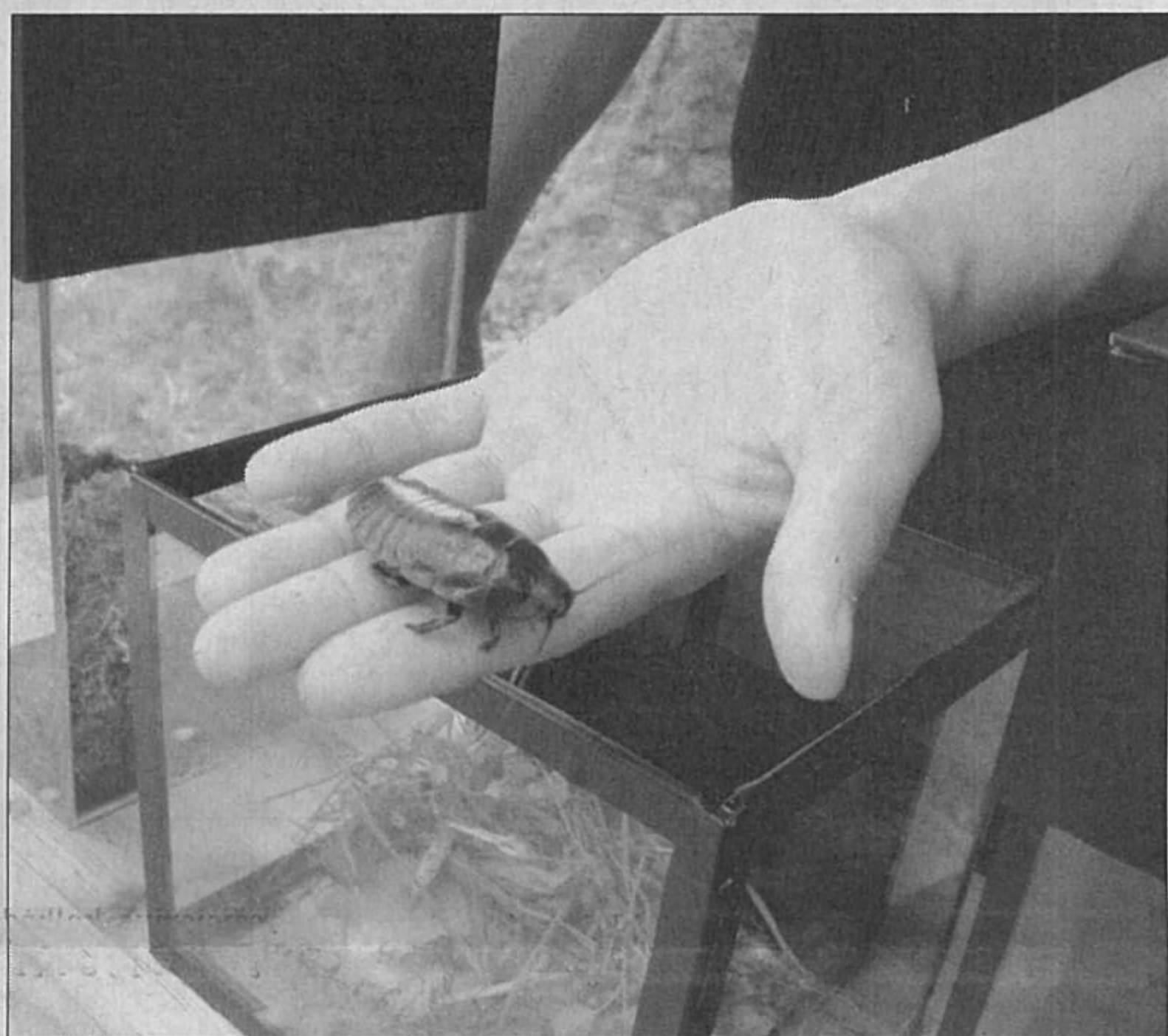
Didžiausias pasaulyje tarakonas.