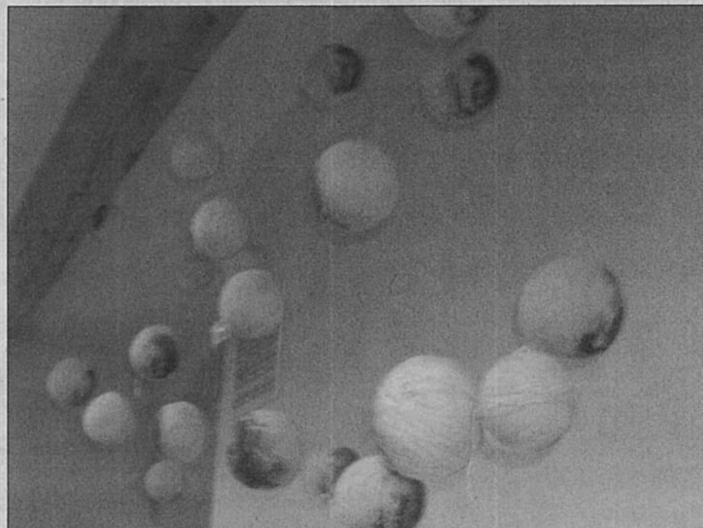
G.Pilypaitės tekstilė „Močiutė“.